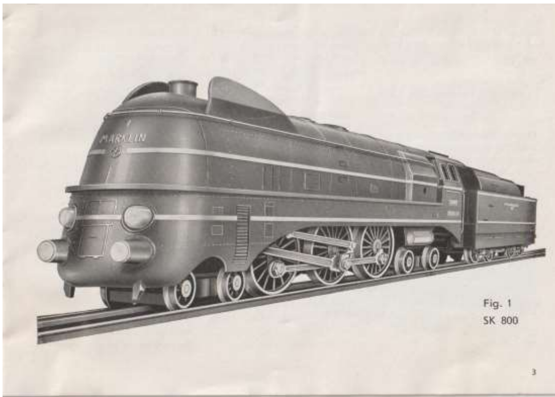
Fig. 1 SK 800